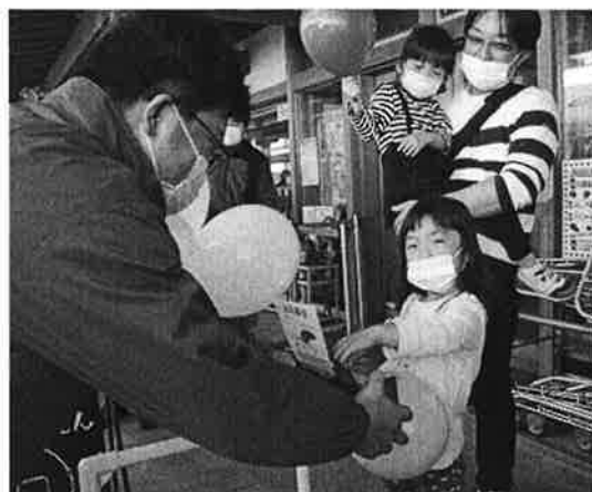
道の駅さんさんでの募金活動