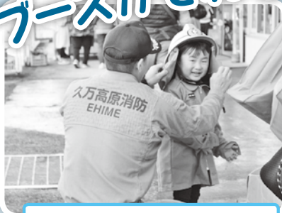
未来の消防士さん参上！