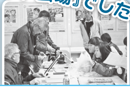
撮った写真がそのまま缶バッジに!!