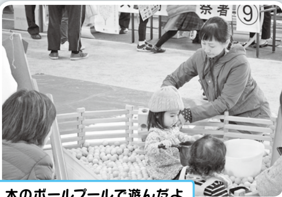
木のボールプールで遊んだよ