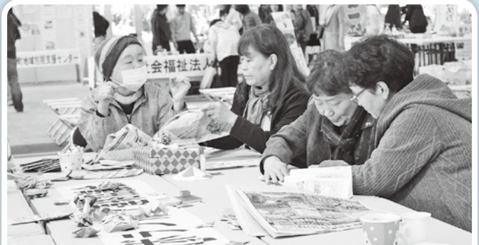
新聞紙で災害グッズ作り