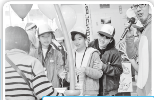
キッズサポーター本領発揮