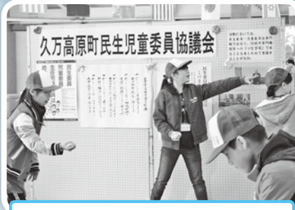
社協キッズサポーターが占領