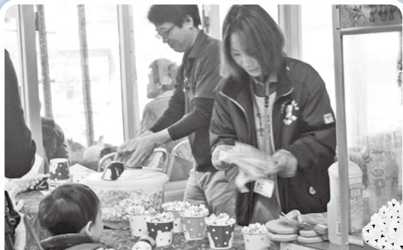
甘い匂いに誘われて、福祉用具体験