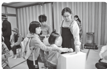
おもごふるさと祭りにて

本年度もみなさんの温かいお気持ちが集まりました。ご協力に心よりお礼申し上げます。