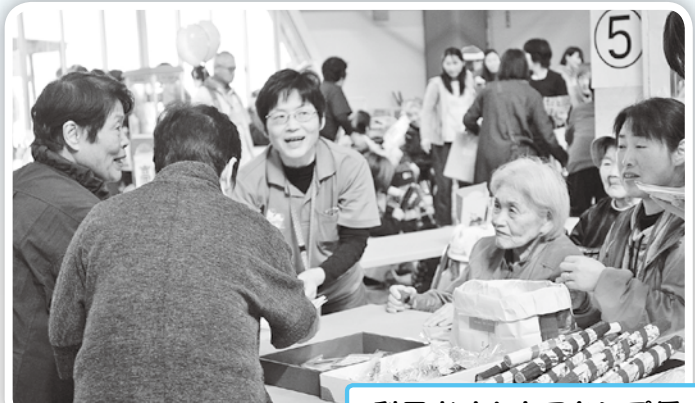
利用者さんもスタンプ係