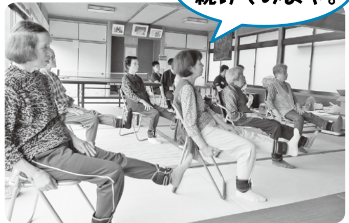
いきいき百歳体操の様子